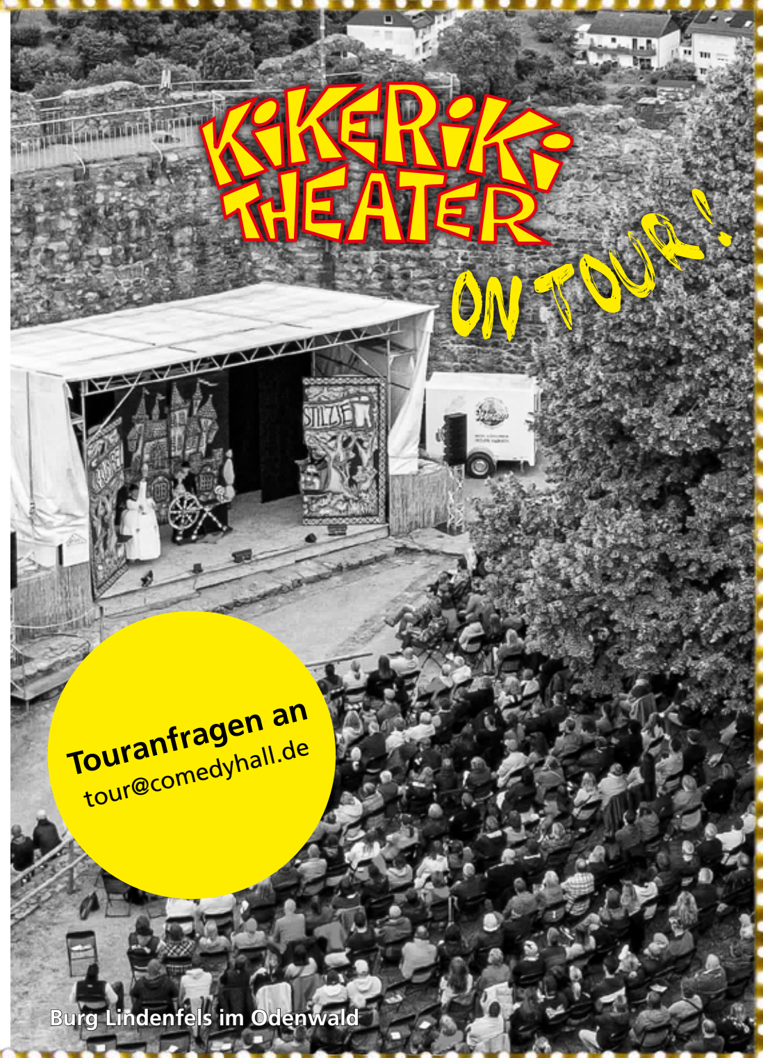
Burg Lindenfels im Odenwald

Das Kikeriki Theater ist ein Theater für das Volk, jedoch nicht volkstümlich mit abgestandenem Heimatmief, sondern mit ehrlich frischem Stallgeruch und ist somit ein Volkstheater im wahrsten Sinne.