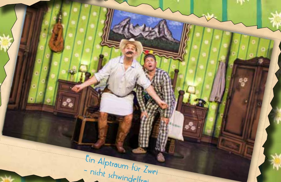
Ein Alptraum für Zwei - nicht schwindelfrei -

Kikeriki Theater in der Comedy Hall Heidelberger Str. 131 Darmstadt